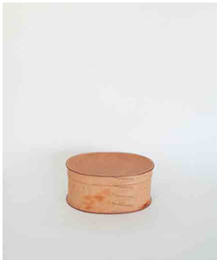
ボックス(エンダースキーマ):2 W360 × D257 × H155mm