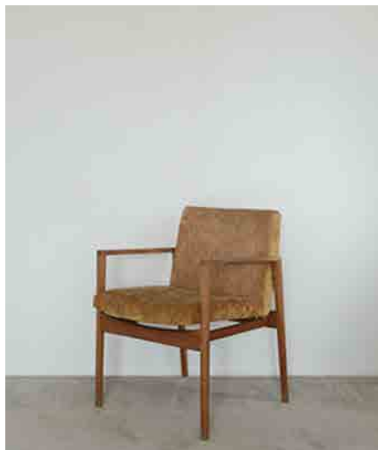
ラウンジチェア W790 × D620 × H820 × SH380mm