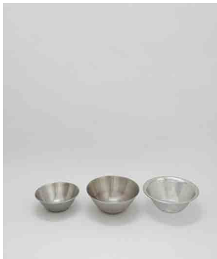
ボウル大/ボウル小/ザル ボウル大:φ158 × H65mm 小:φ132 × H50mm ザル:φ164 × H63mm