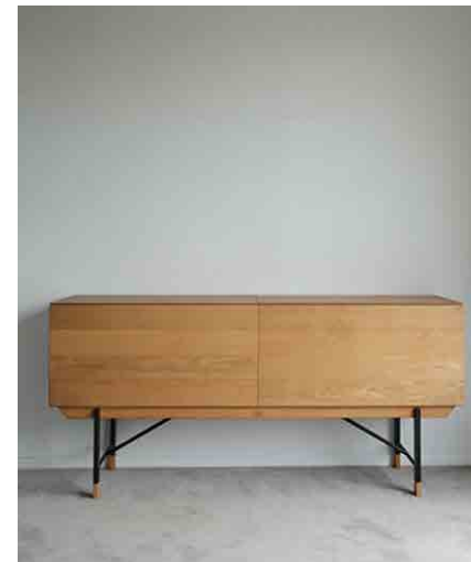
キャビネットC W1700 × D440 × H810mm