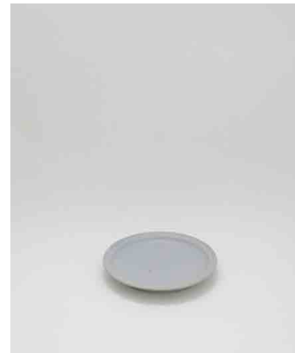
プレート/水色:3 φ190 × H25mm