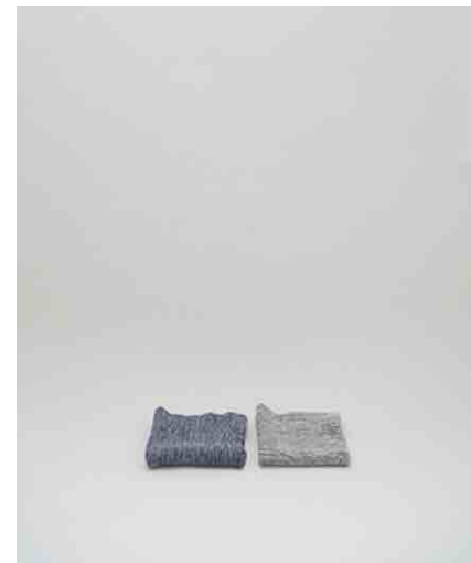
キッチンクロス グレー/ネイビー W250 × H250mm