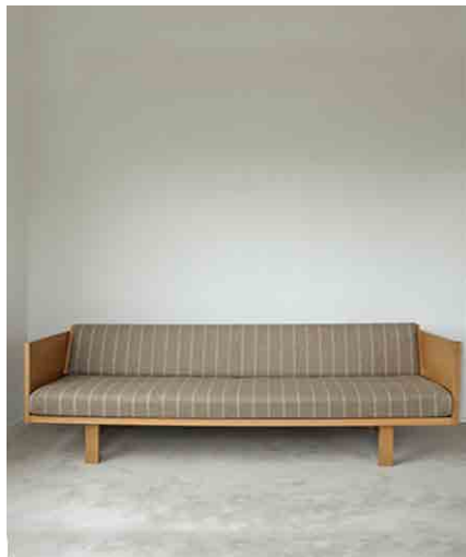
ベッドソファー W2054 × D870 × H670 × SH420mm