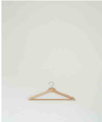
ハンガー:9 W430 × H220mm