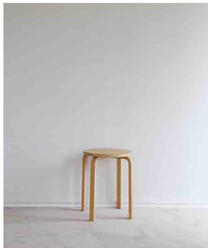
スツール:5 W350 × D350 × H450 × SH350mm