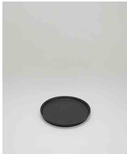
ラウンドプレートL/マットブラック:3 φ260 × H22mm