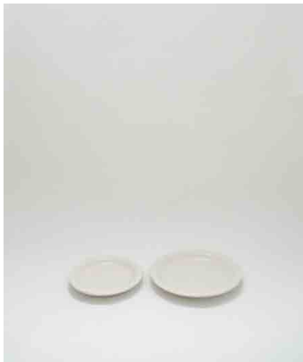
平皿 大:4 / 小:5 大:φ230 × H30mm 小:φ180 × H30mm