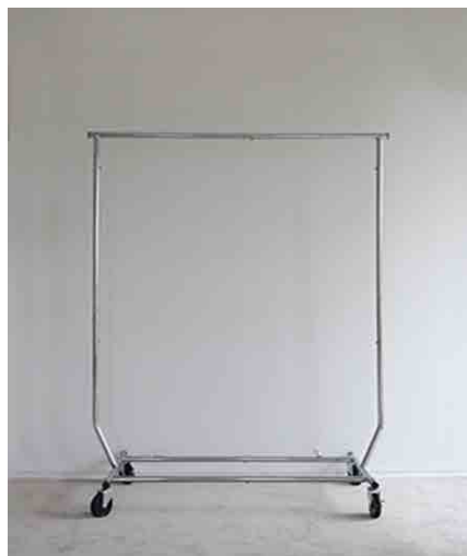
ハンガーラック:1 W1300 × D552 × H1675mm