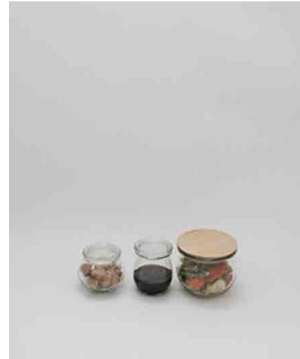
キャニスター-C 3種 左:φ85 × H79mm 中:φ75 × H85mm 右:φ110 × H90mm