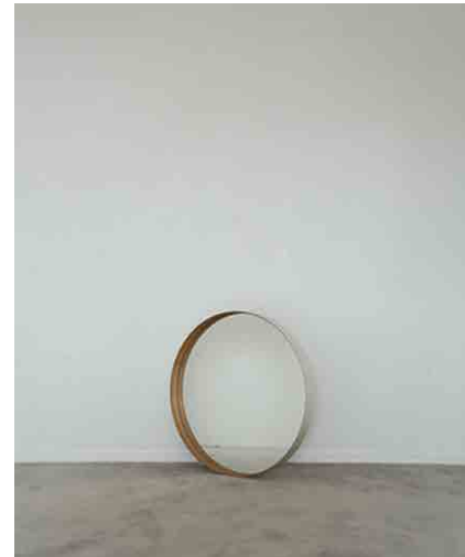
ラウンドミラー φ340 × H20mm