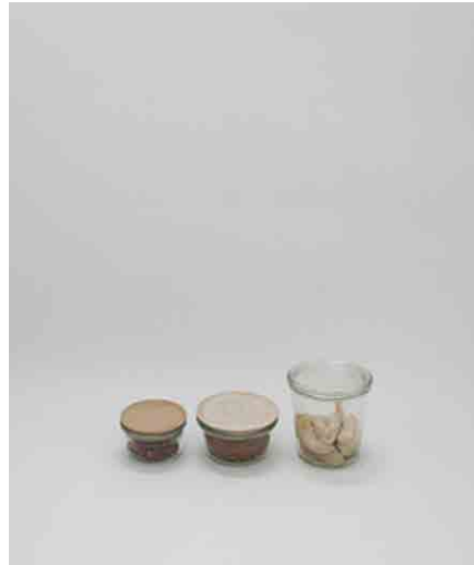
キャニスター-B 3種 左:φ90 × H50mm 中:φ110 × H55mm 右:φ110 × H110mm