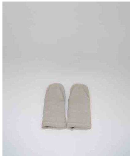
ミトン W300 × D140 × H50mm