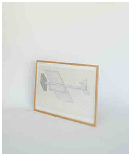
ポスター W520 × D25 × H410mm