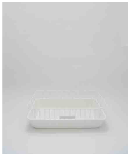
水切りカゴ W285 × D410 × H124mm