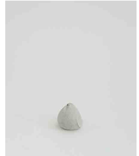
オブジェ/小鳥 W60 × D50 × H50mm