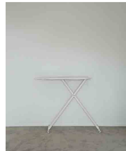
アイロン台:1 W1210 × D380 × H840mm