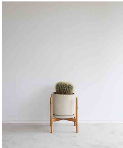
サポテン 鉢のみ \phi 320 × H300mm 全体 W350 × D320 × H620mm