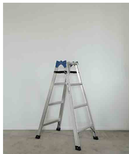
脚立:1 W510 × D750 × H1100mm