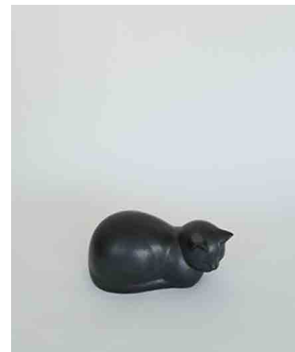
オブジェ/猫(Lisa Larson) W293 × D148mm