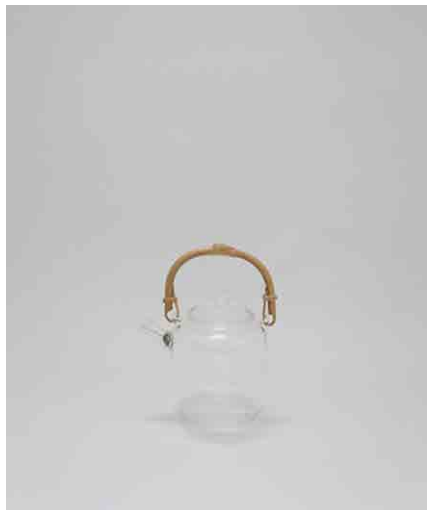
ティーポット(STUDIO PREPA) φ105 × H170mm