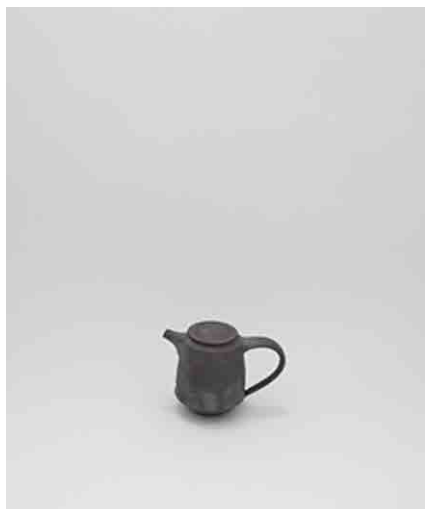
ティーポット φ105 × H170mm