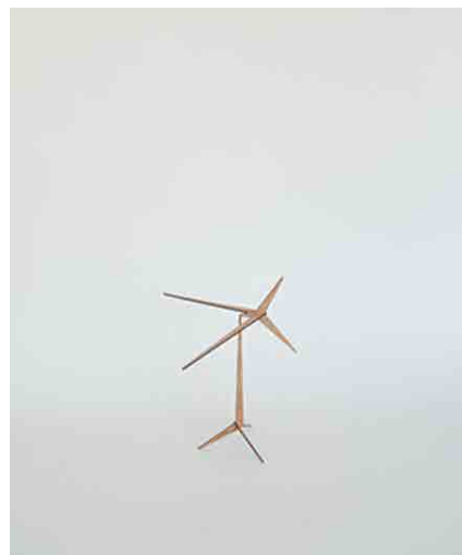
モビール W360 × D360 × H360mm