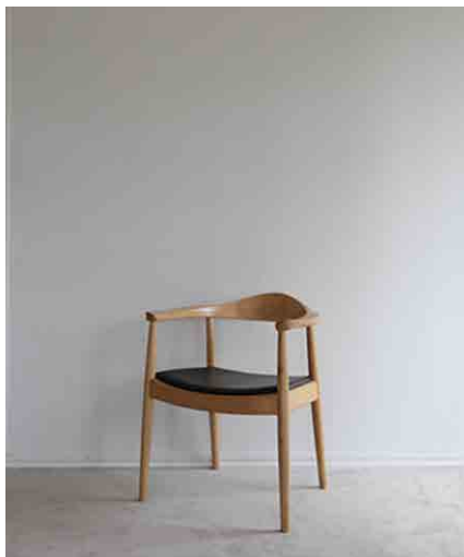
チェアA W640 × D550 × H740 × SH440mm