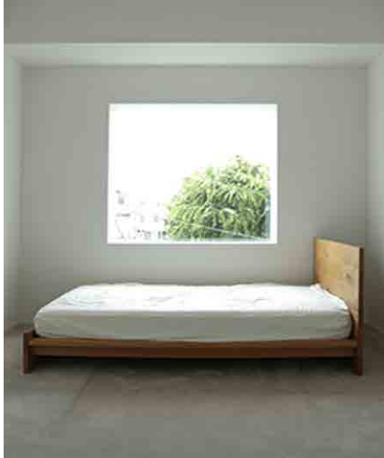
ベッド W1370 × D2000 × H830 × SH390mm