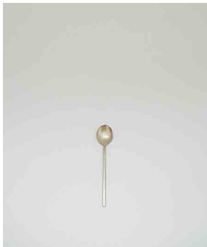
スプーン(Georg Jensen):3 φ50 × H220mm