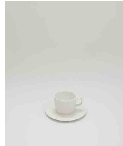
カップ&ソーサーB:2 カップ:φ82 × H59mm ソーサー:φ157 × H10mm