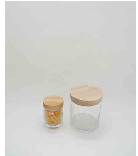
キャニスター 大:2 / 小:1 大:φ159 × H160mm 小:φ102 × H140mm