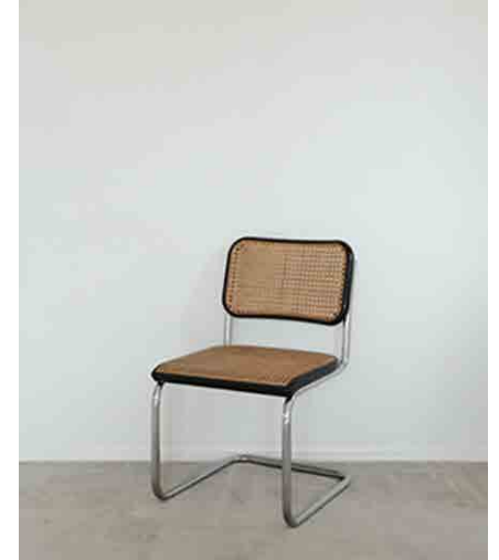
チェスカチェア:2 W460 × D520 × H780 × SH420mm