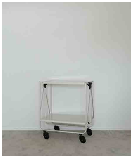
カメラワゴン:1 W600 × D400 × H721mm