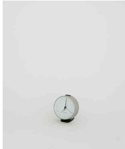
置き時計 W100 × D80 × H110mm