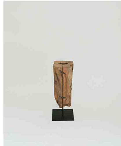
ウッドベースキャンドルホルダー W140 × D140 × H350mm