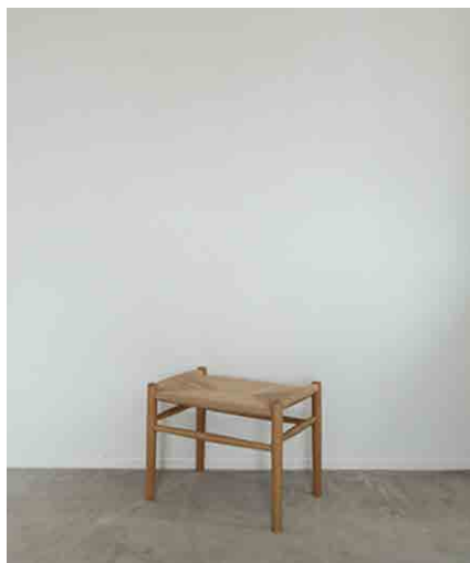
オットマン W520 × D370 × H410 × SH380mm