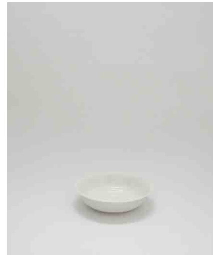
深皿/白:5 :φ150 × H80mm