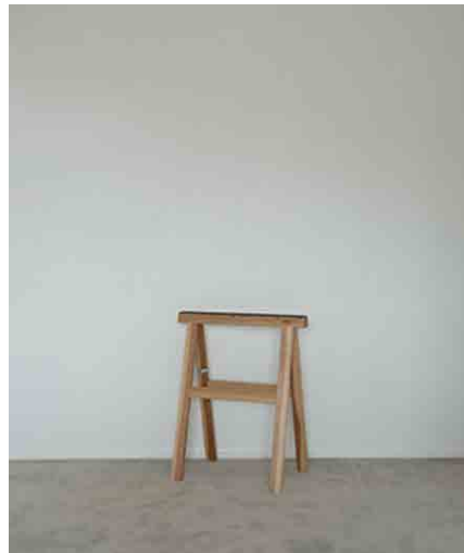
架台:2脚1セット W440 × D300 × H700mm