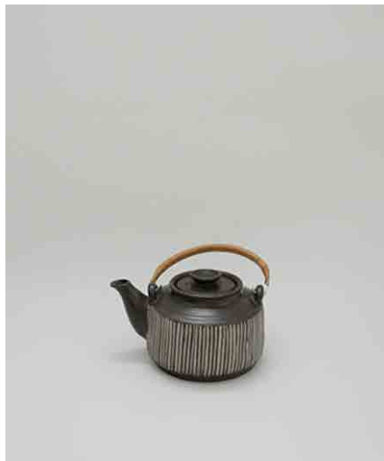
急須 φ93 × H112mm