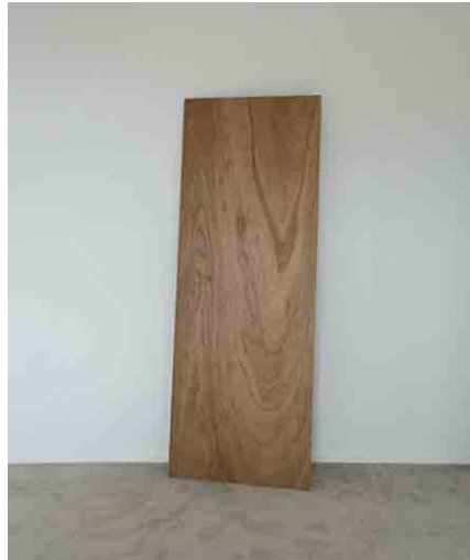
天板 W580 × H1800mm