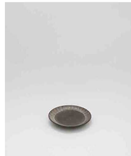
平皿/黒:4 φ260 × H22mm