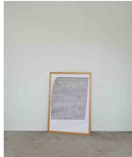
ポスター W525 × D30 × H410mm (額縁込み)