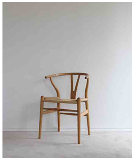
Yチェア:4 W550 × D510 × H760 × SH450mm