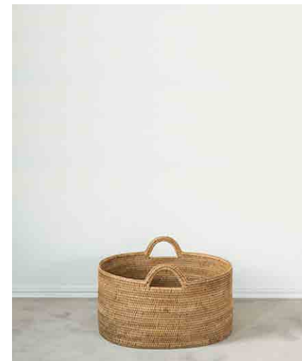
バスケット \phi 550 × H420mm