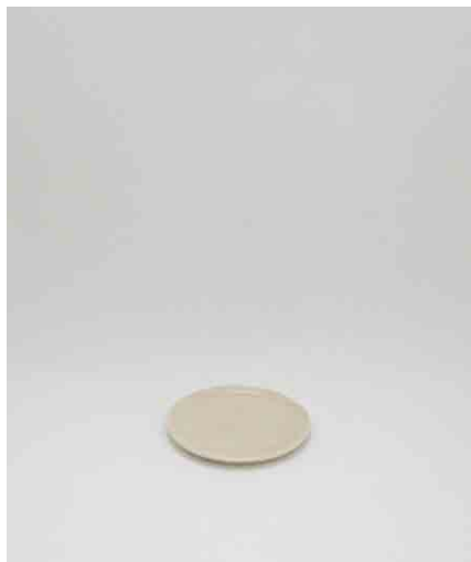
ソーサー/ホワイト:3 φ160 × H16mm