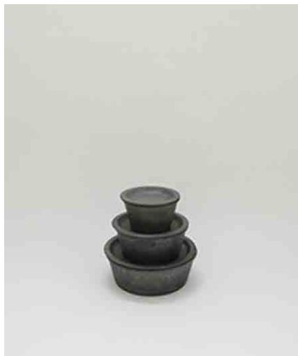
ボウルセットS/M/L:各1 S:φ106 × H58mm M:φ137 × H58mm L:φ166 × H60mm