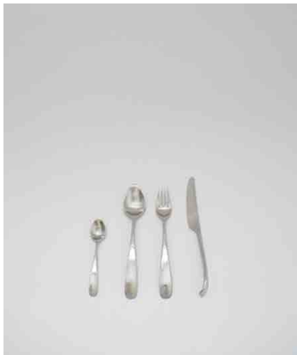
カトラリーセット ティースプーン:2 / ディナーズプーン:3 フォーク:1 / ナイフ:3(Georg Jensen)