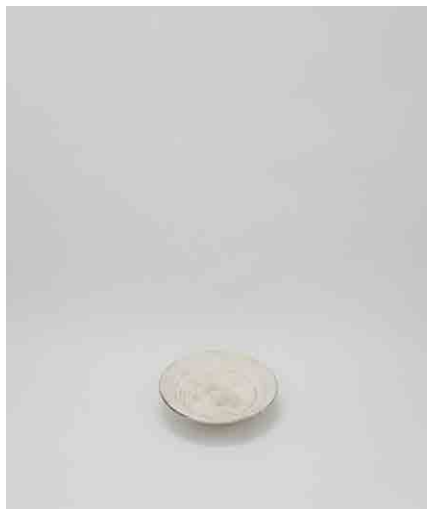
白皿:3 φ175 × H38mm