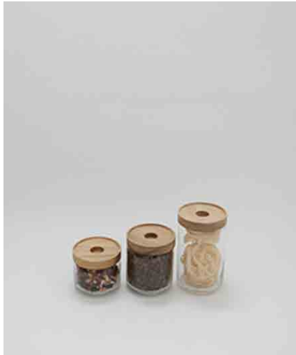
キャニスター-A 3種 左:φ90 × H75mm 中:φ90 × H100mm 右:φ90 × H150mm