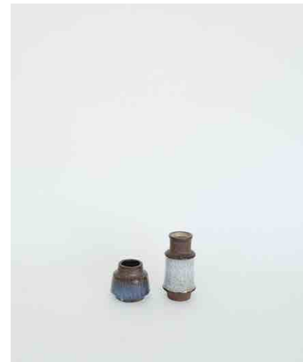
フラワーベース A/B A:φ底面70 中95 上55 × H85mm B:φ底面55 中80 上55 × H155mm