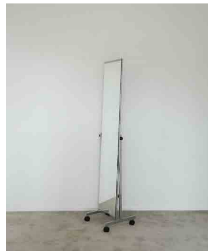
姿見:1 W340 × H1580mm