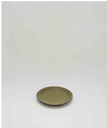
プレート/緑:3 φ192 × H20mm