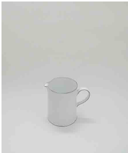
キッチンツール入れ φ130 × H154mm