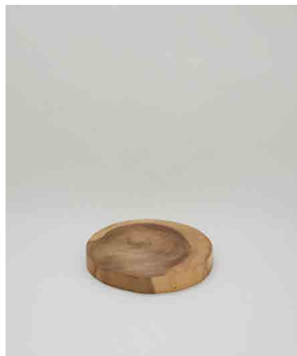
カッティングボードA φ255 × H25mm