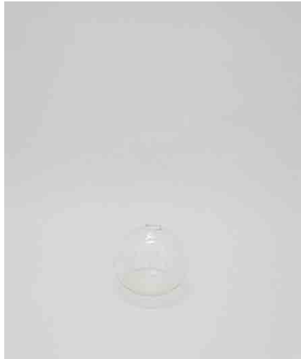
ガラスベースB φ93 × H76mm