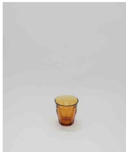
グラス/ブラウン:4 φ80 × H84mm