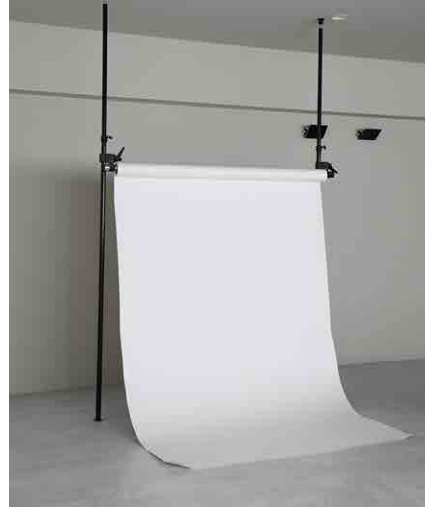
有料バック紙セット ¥3,300/1day (バック紙,オートポール,エクステンションポール) ホワイトバック紙 W1360mm オートポール H1750mm~3300mm