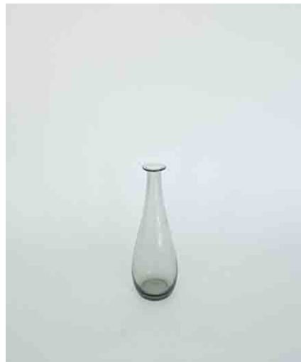
ガラスベースA φ100 × H320 × 内径50mm