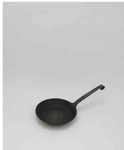
フライパン(Turk) 全長339 W170 × D170 × H20mm