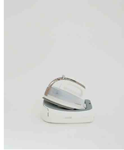
アイロン:1 W230 × D100 × H250mm