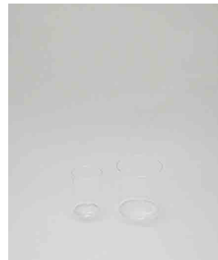
クリアグラス 大:2 / 小:3 大:φ74 × H78mm 小:φ50 × H68mm