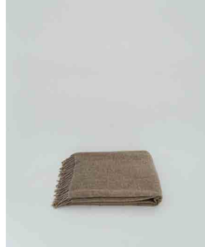
ベッドスロー W1770 × D1340mm(横置き)