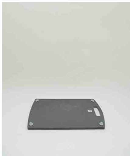
まな板 W370 × D270 × H10mm