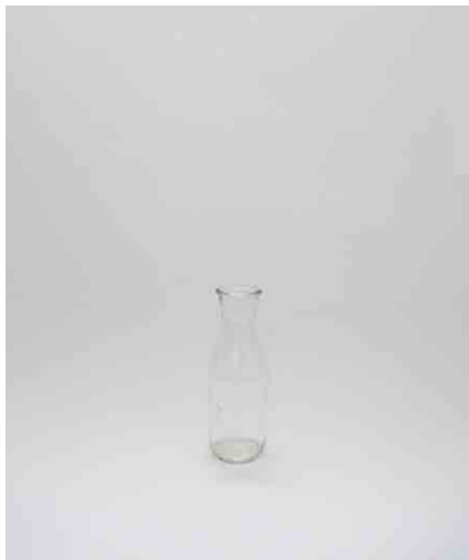
デキャンタボトル:2 φ80 × H260mm