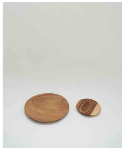
アカシアプレート 大/小 各:5 大:φ260 × H20mm 小:φ150 × H20mm