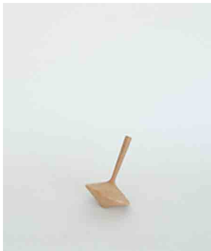
オブジェ/コマ W120 × D120 × H200mm