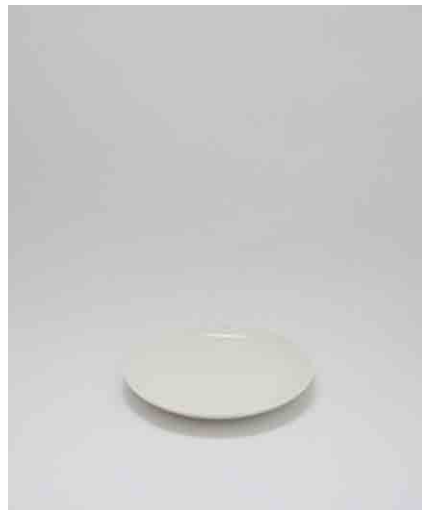
プレート/白:5 φ180 × H40mm