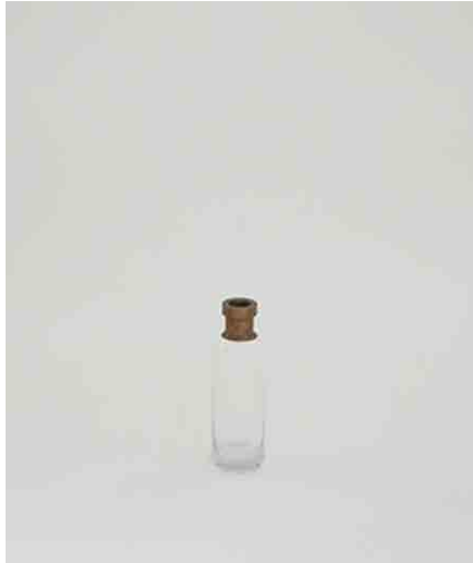
フラワーベース φ650 × H210mm