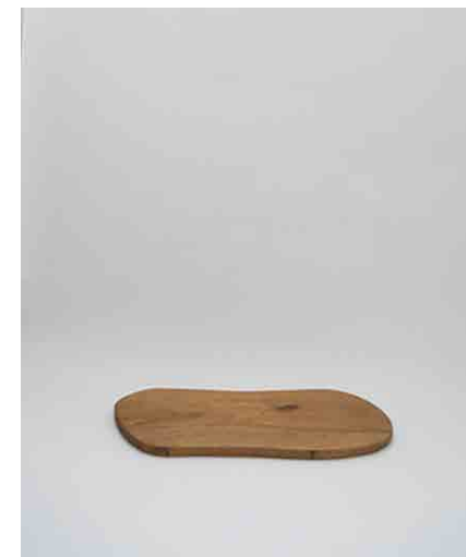
カッティングボードC W450 × D190 × H16mm