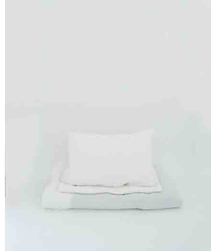
枕/布団/シーツ 枕:W560 × D320 × H180mm 布団:W1900 × D1180 × H175mm フラットシーツ:W2850 × D2240mm