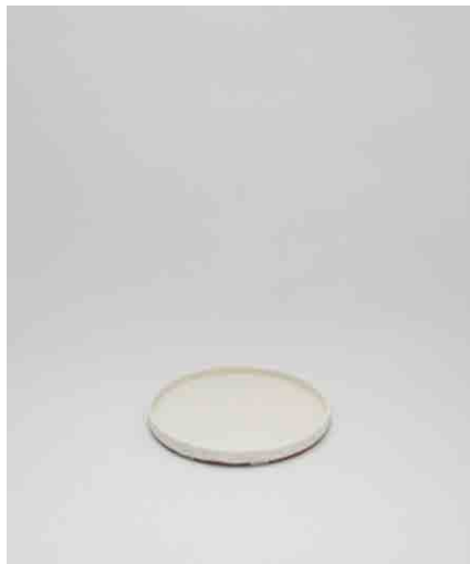
切立皿:3 φ215 × H17mm