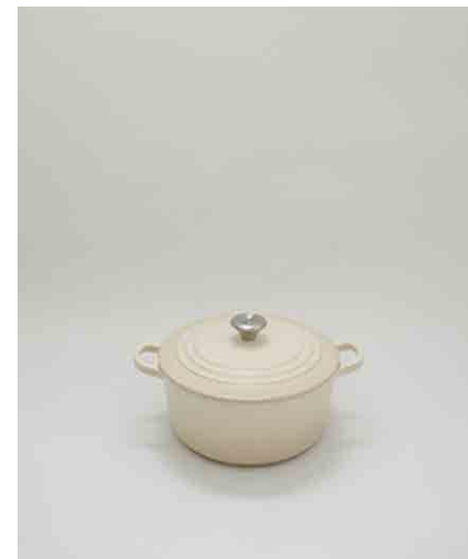
鍋(Le Creuset) W299 × D240 × H155mm