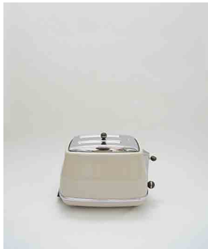
トースター W165 × D280 × H240mm