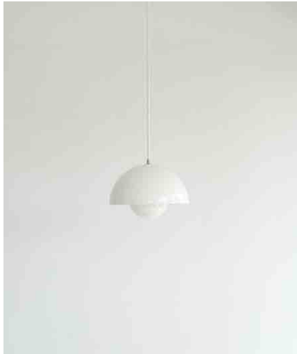
シーリングライト W230 × H140mm