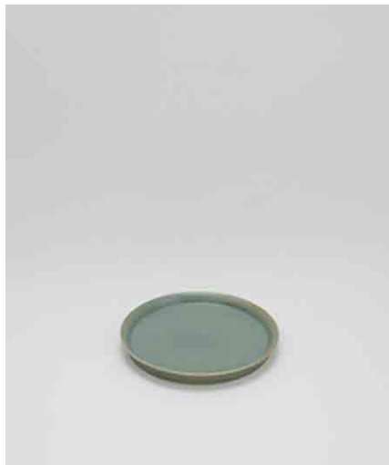
ラウンドプレートM/ターコイズ:3 φ184 × H20mm