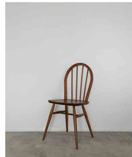
チェアB W400 × D380 × H850 × SH440mm