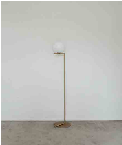
ランプ(FL0S) W311 × D275 × H1350mm