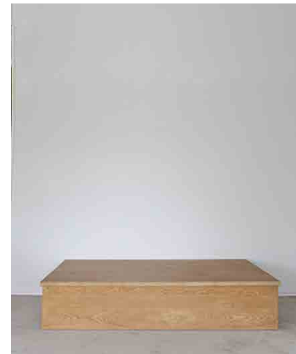
ローテーブルA W2000 × D1500 × H400mm