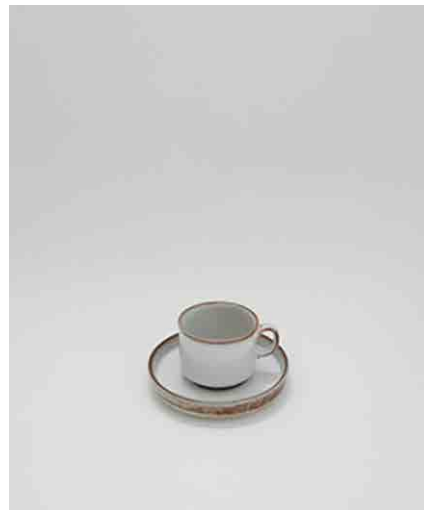
カップ&ソーサーA:3 カップ:φ84 × H65mm ソーサー:φ150 × H25mm