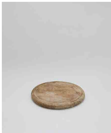
カッティングボードB φ244×H30