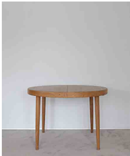
ダイニングテーブル W1120 × D1115 × H720mm