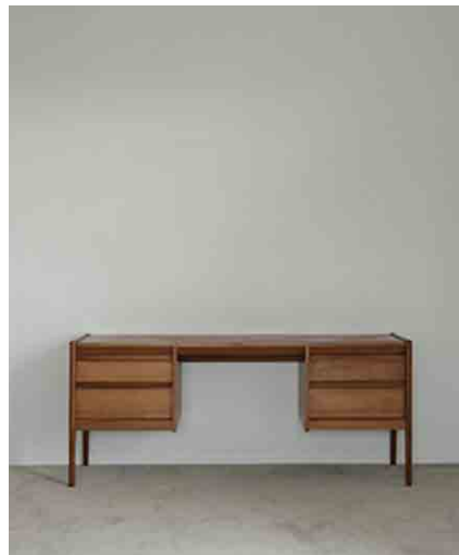
デスク W152 × D46 × H68mm