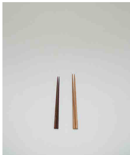
箸/ブラウン:5 ナチュラル:2 ブラウン:全長220mm ナチュラル:全長230mm