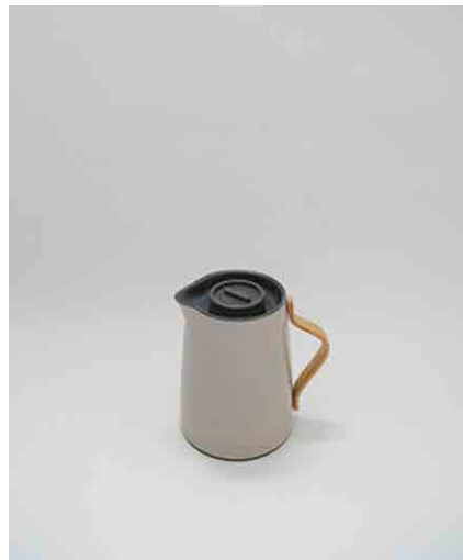
ジャグ W170 × H250mm