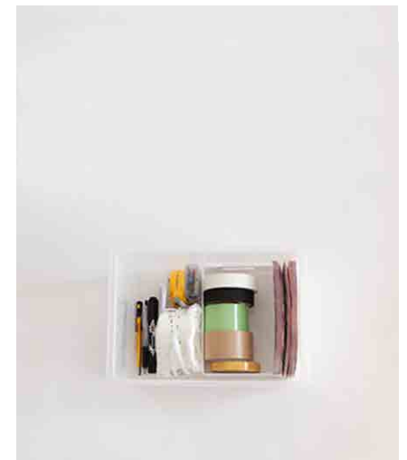
お道具箱 (はさみ、カッター、メジャー、油性ペン、ボールペン、ビニール ひも、パーマセル白、パーマセル黒、養生テープ、セロテープ、 ガムテープ、ドライバー)