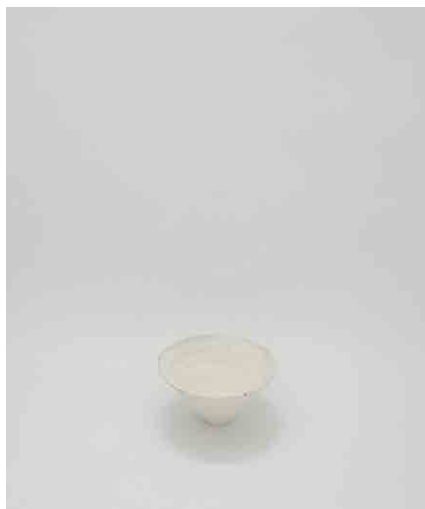
白碗:3 φ147 × H80mm