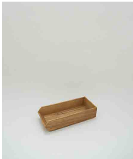
カトラリーケース:2 W260 × H60 × D106mm