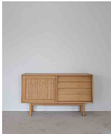
キャビネットB W1300 × D420 × H760mm