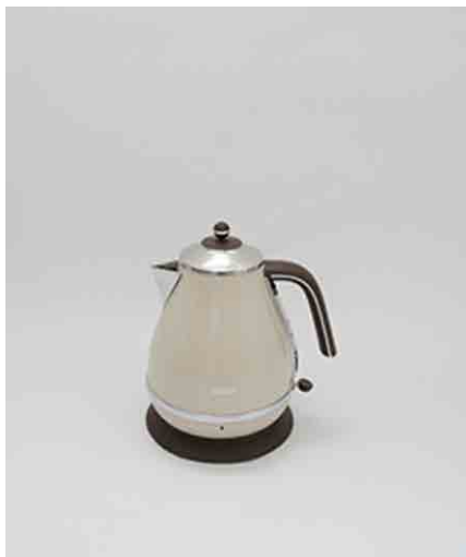
ケトルB φ150 × H220mm