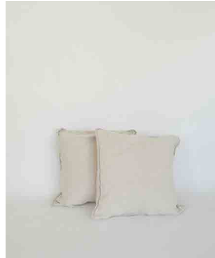
クッション:4 W430 × D430 × H120mm