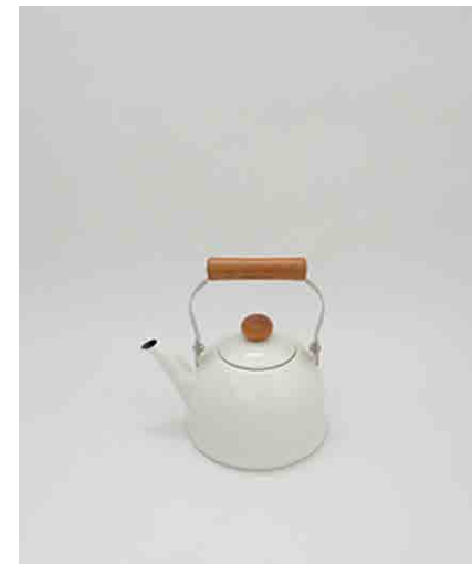
ケトルA W255 × D210 × H185mm