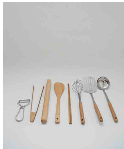
キッチンツール各種 (ピーラー、トング、麺棒、木ベラ、菜箸、泡立て器、ターナー、おたま)