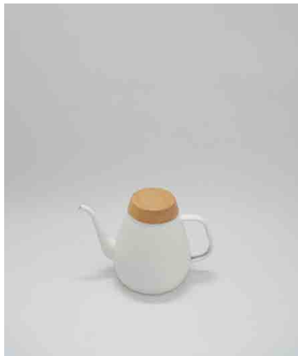
ドリップケトル φ150 × H220mm