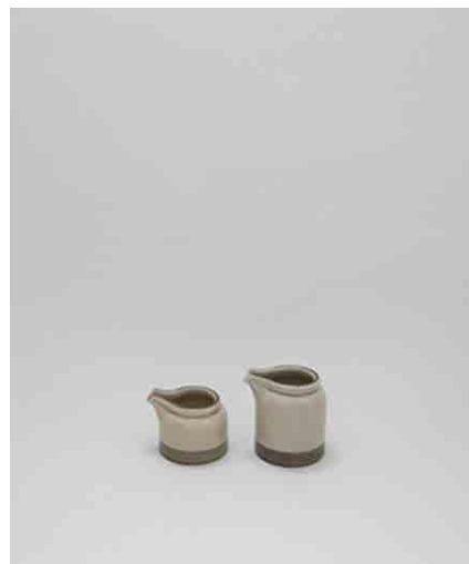
差し湯入れ 大/小 大:φ84 × H95mm 小:φ83 × H65mm