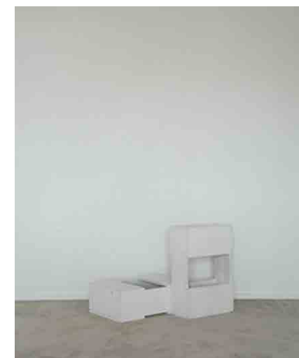
箱馬:5 W450 × D300 × H150mm