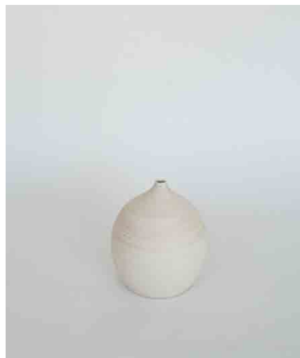
一輪挿し W140 × D180 × H210mm