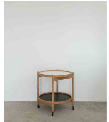
サイドテーブル φ500 × H550mm