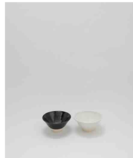
お碗 白/黒 φ125 × H55mm