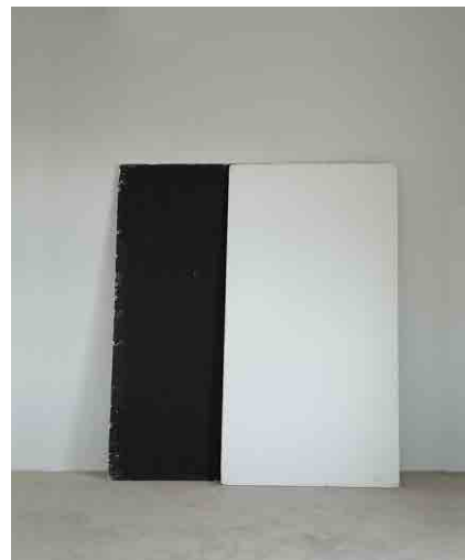
カボック:5 W920 × D400 × H1830mm ※開閉不可