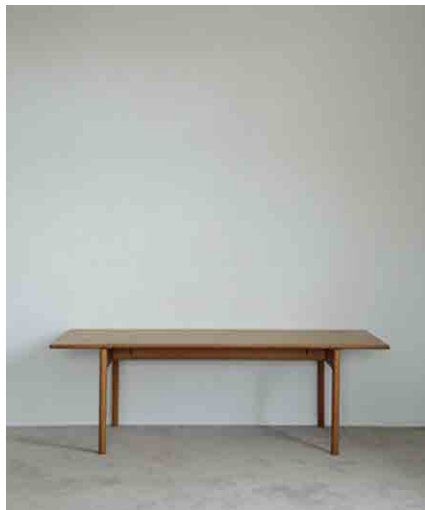
ローテーブルB W1500 × D600 × H480mm