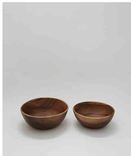
アカシアボール 大/小 各:3 大:φ240 × H90mm 小:φ200 × H80mm